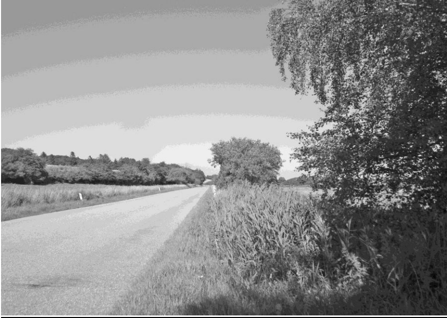
"Gyngemosen" set fra Lindbjerg Skovvej mod Tvede.