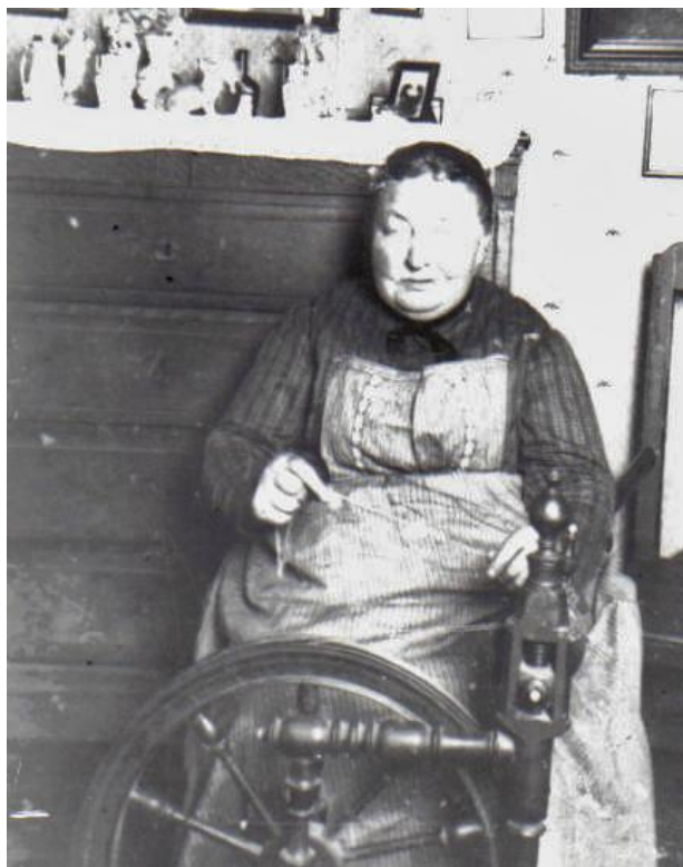
Due Stine ved rokken

Harridslev, den 10. Juli 1927. Sogneraadet.